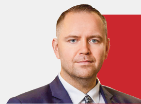
DR KAROL NAWROCKI PREZES IPN