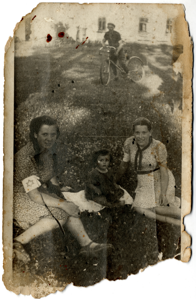
Zdjęcie markowskich Żydówek autorstwa Józefa Ulmy. 24 marca 1944 r. na fotografię padły krople krwi ofiar niemieckiej zbrodni (ze zbiorów krewnych rodziny Ulmów)