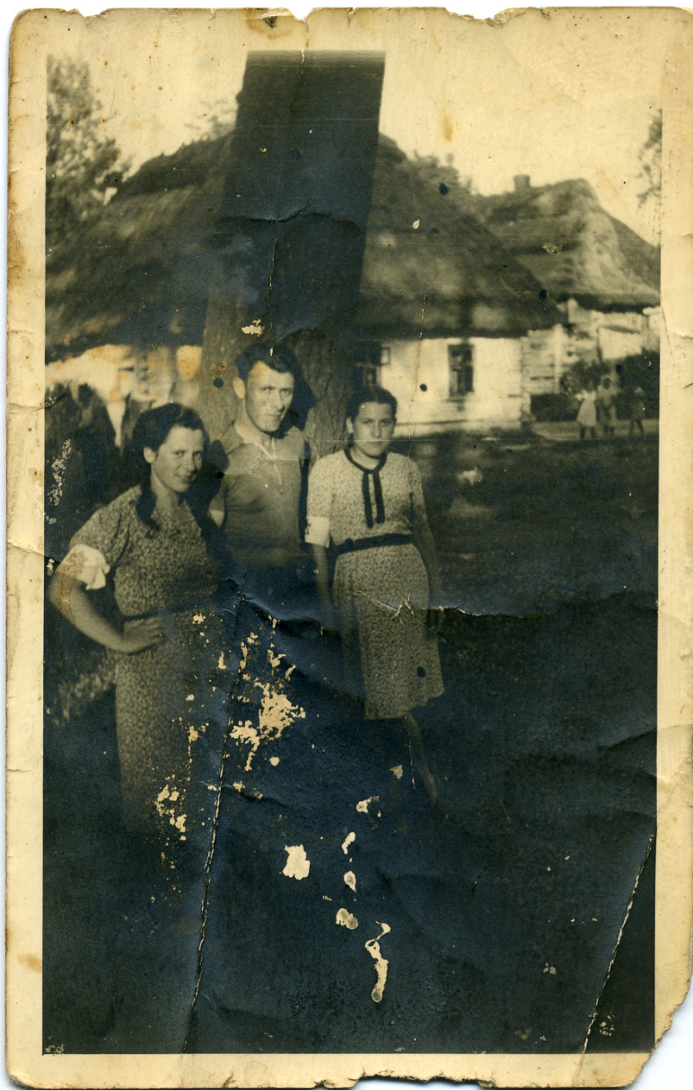
Młodzież żydowska z Markowej (ok. 1940 r.)