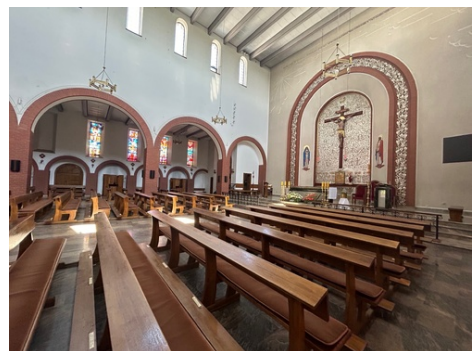
Prezentacja wystawy IPN „Błogosławieni Ulmowie z Markowej” w kościołach archidiecezji warszawskiej w związku z peregrynacją relikwii bł. Rodziny Ulmów - Warszawa, Parafia Zesłania Ducha Świętego