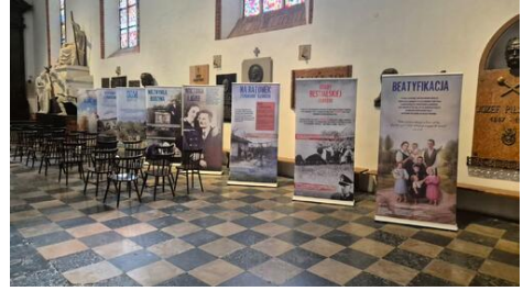
Prezentacja wystawy IPN „Błogosławieni Ulmowie z Markowej” w kościołach archidiecezji warszawskiej w związku z peregrynacją relikwii bł. Rodziny Ulmów - Archikatedra Warszawska