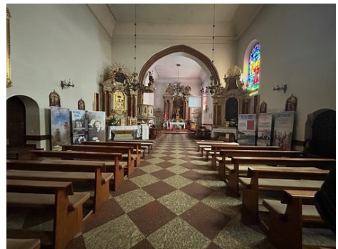
Prezentacja wystawy IPN „Błogosławieni Ulmowie z Markowej” w kościołach archidiecezji warszawskiej w związku z peregrynacją relikwii bł. Rodziny Ulmów - Parafia św. Anny w Piasecznie