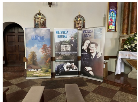
Prezentacja wystawy IPN „Błogosławieni Ulmowie z Markowej” w kościołach archidiecezji warszawskiej w związku z peregrynacją relikwii bł. Rodziny Ulmów - Parafia św. Anny w Piasecznie