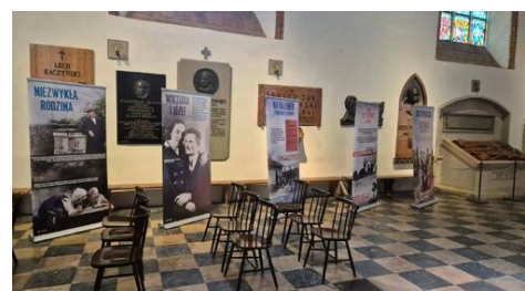
Prezentacja wystawy IPN „Błogosławieni Ulmowie z Markowej” w kościołach archidiecezji warszawskiej w związku z peregrynacją relikwii bł. Rodziny Ulmów - Archikatedra Warszawska