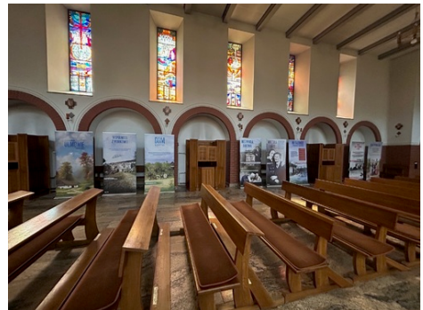
Prezentacja wystawy IPN „Błogosławieni Ulmowie z Markowej” w kościołach archidiecezji warszawskiej w związku z peregrynacją relikwii bł. Rodziny Ulmów - Warszawa, Parafia Zesłania Ducha Świętego