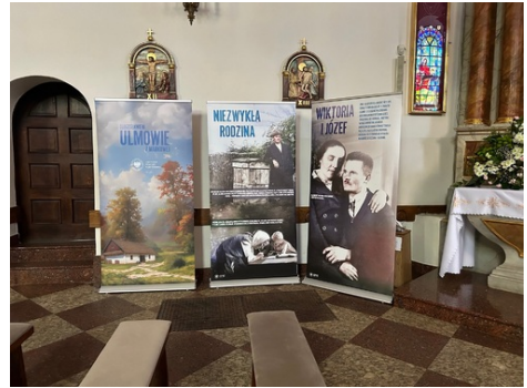
Prezentacja wystawy IPN „Błogosławieni Ulmowie z Markowej” w kościołach archidiecezji warszawskiej w związku z peregrynacją relikwii bł. Rodziny Ulmów - Parafia św. Anny w Piasecznie