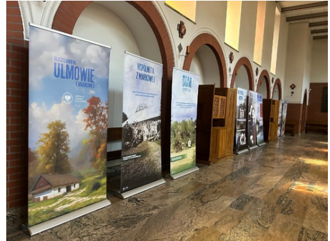
Prezentacja wystawy IPN „Błogosławieni Ulmowie z Markowej” w kościołach archidiecezji warszawskiej w związku z peregrynacją relikwii bł. Rodziny Ulmów - Warszawa, Parafia Zesłania Ducha Świętego