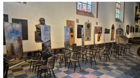
Prezentacja wystawy IPN „Błogosławieni Ulmowie z Markowej” w kościołach archidiecezji warszawskiej w związku z peregrynacją relikwii bł. Rodziny Ulmów - Archikatedra Warszawska