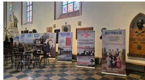
Prezentacja wystawy IPN „Błogosławieni Ulmowie z Markowej” w kościołach archidiecezji warszawskiej w związku z peregrynacją relikwii bł. Rodziny Ulmów - Archikatedra Warszawska