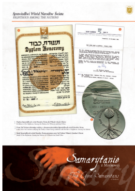
Sprawiedliwi wśród Narodów Świata