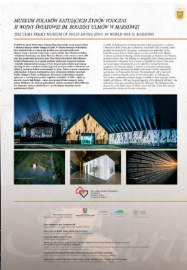
Muzeum Polaków Ratujących Żydów podczas II wojny światowej im. Rodziny Ulmów w Markowej