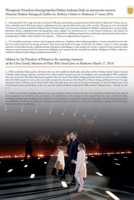
Wystąpienie Prezydenta RP Andrzeja Dudy na uroczystości otwarcia Muzeum Polaków Ratujących Żydów podczas II wojny światowej im. Rodziny Ulmów w Markowej 17 marca 2016