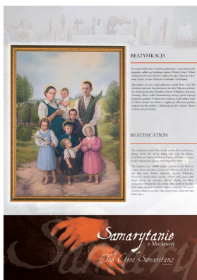
Panel Beatyfikacja [PL/ENG]