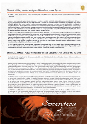
Ulmowie - Polacy zamordowani przez Niemców za pomoc Żydom